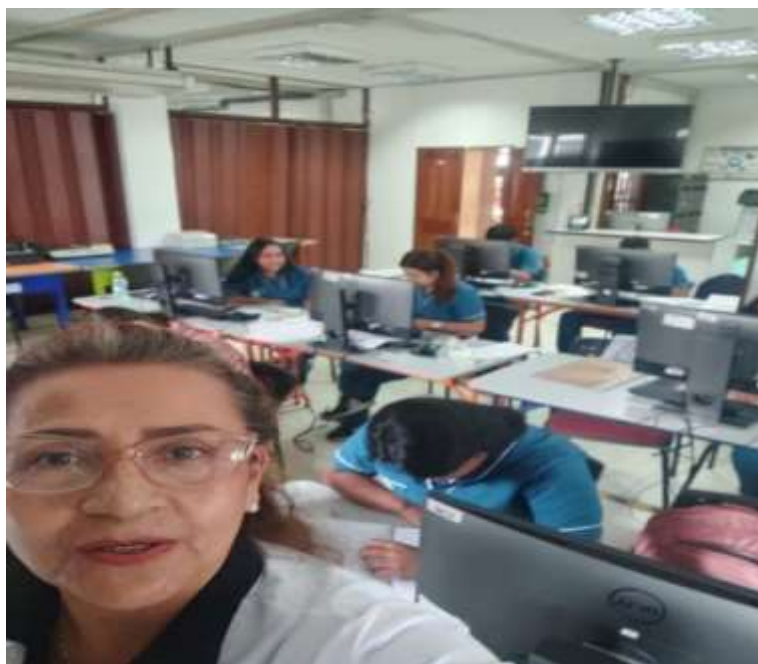
Fig. No.2 Ficha 3172882 Gestión Documental – Realizando Descripción Documental