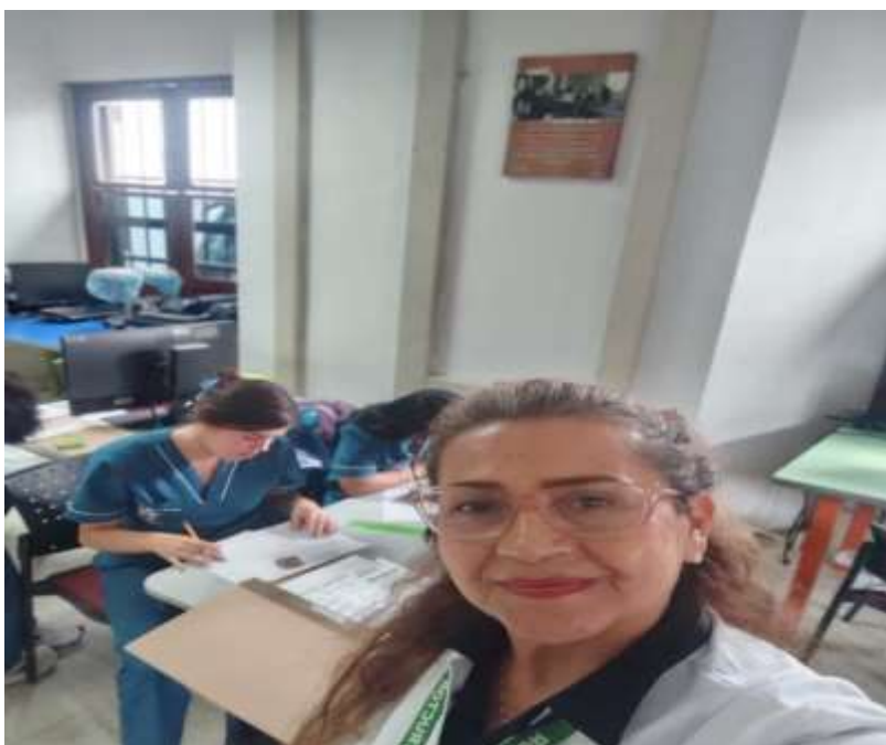
Fig. No.1 Ficha 3172882 Gestión Documental – Realizando Descripción Documental