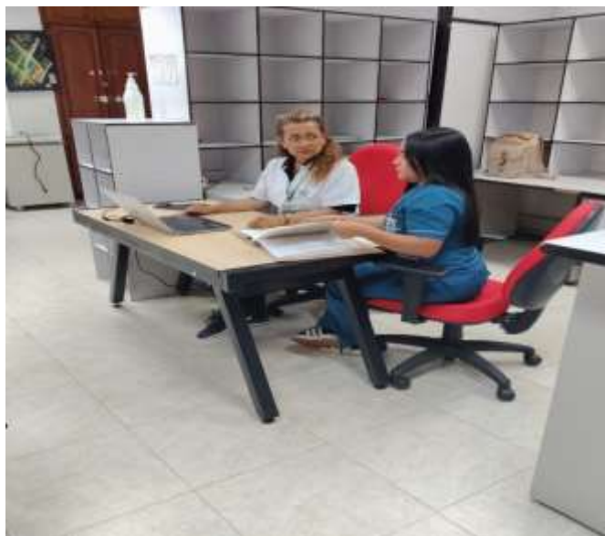
Fig. No.3 Ficha 3172882 Gestión Documental – Revisión de carpetas organizadas

SEDE: BATALLON DE APOYO Y SERVICIO PARA EL COMBATE No. 29