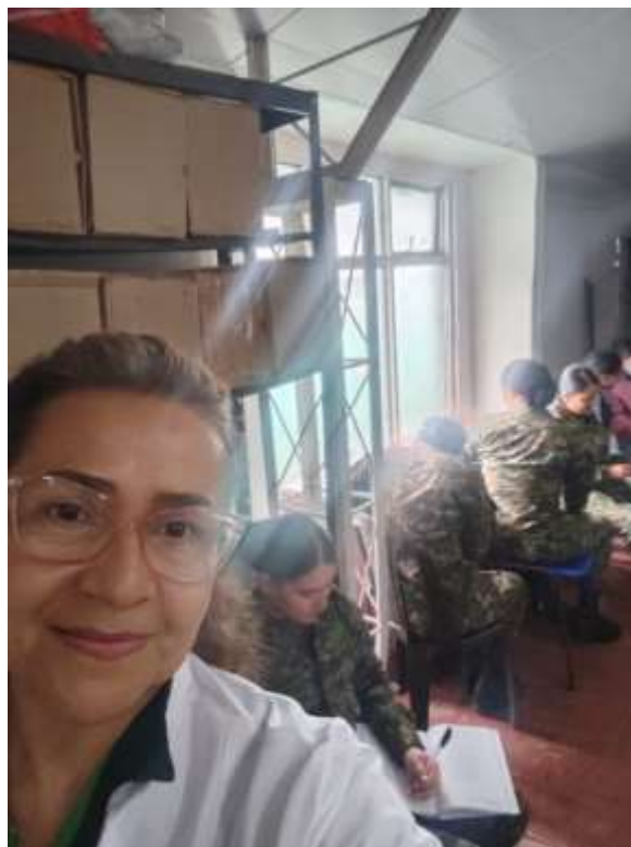
Fig. No.4 Ficha 3479053 Técnico en Organización de Archivos – Fundamentación Archivística

FICHA: 3479053 TECNICO EN ASISTENCIA EN ORGANIZACIÓN DE ARCHIVOS.