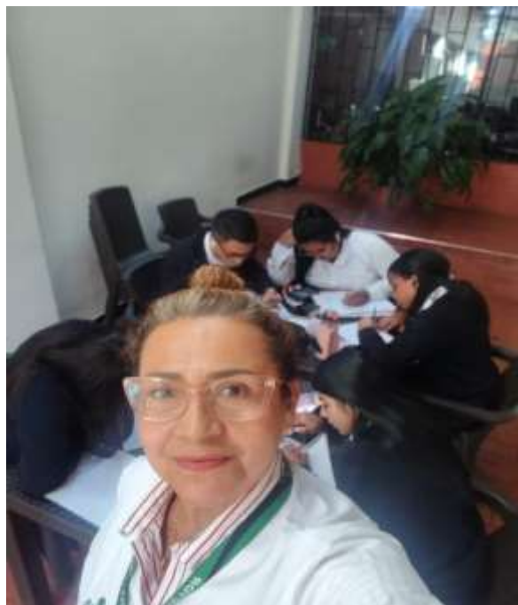
Fig. No.7 Ficha 3315124 Asistencia Administrativa – Ambiente 103 – CUT