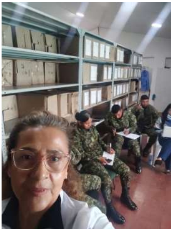
Fig. No.5 Ficha 3479053 Técnico en Organización de Archivos – Fundamentación Archivística